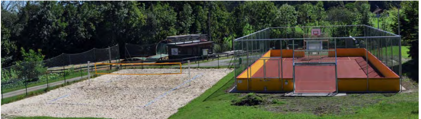
Foto: links der bestehende Beach Volleyballplatz, rechts der neue Soccer Platz - beide sind hinter dem Gemeindezentrum situiert.