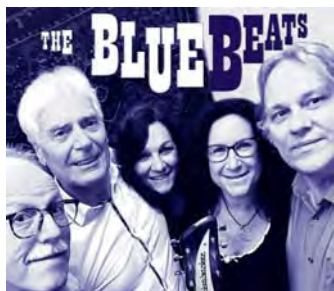
Foto: The Bluebeats

Sommerfest im Camp24 mit Live Band Samstag, 25. August ab 17 Uhr